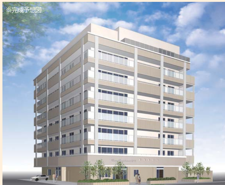
※完成予想図 来年3月伊丹市西台に開設する介護付有料老人ホームは、阪急伊丹駅から徒歩2分・JR伊丹駅から徒歩12分。

高齢者ケアに重点をおいてきた本院の新しい展開として、来年3月に介護付有料老人ホームを開業いたします。地域の皆様が住み慣れた土地で安心して暮らせるよう、医療と介護が一体になった高齢者の住まいになる予定です。かねてより計画を進めており、いよいよ今年3月から工事がスタートいたしました。