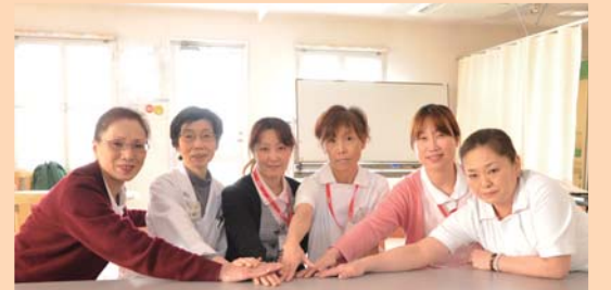
医師、看護師、社会福祉士で結成された地域連携室のメンバーたち

常岡病院の「地域連携室」をご存知ですか？ 地域連携室は、患者様が入院している間、または退院した後も安心して療養生活を送るための手助けをいたします。近隣の病院や診療所、行政機関と連携し、地域のネットワークを生かして問題解決に努めます。