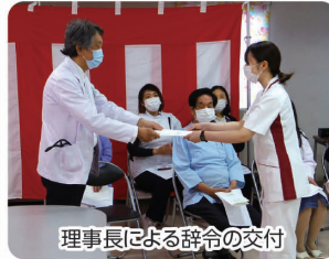
理事長による辞令の交付