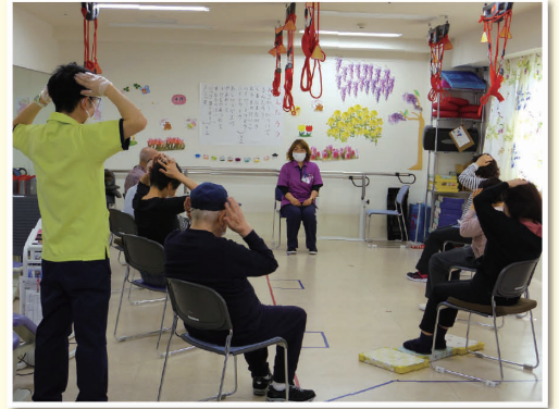
【エクササイズの風景】

また、シナプソロジー®が指導できるのは、認定された指導員だけです。ご興味のある方は、ぜひ、エミアスにご相談ください。